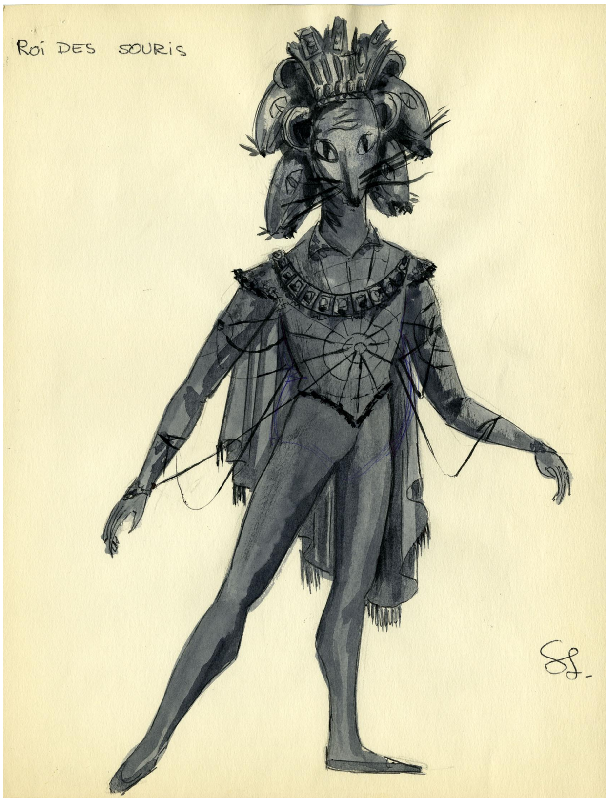
Esquisse du costume du Roi des souris, 1964.

Collection de BAQ, Archives nationales à Montréal, fonds Solange Legendre (06M_P846_07).