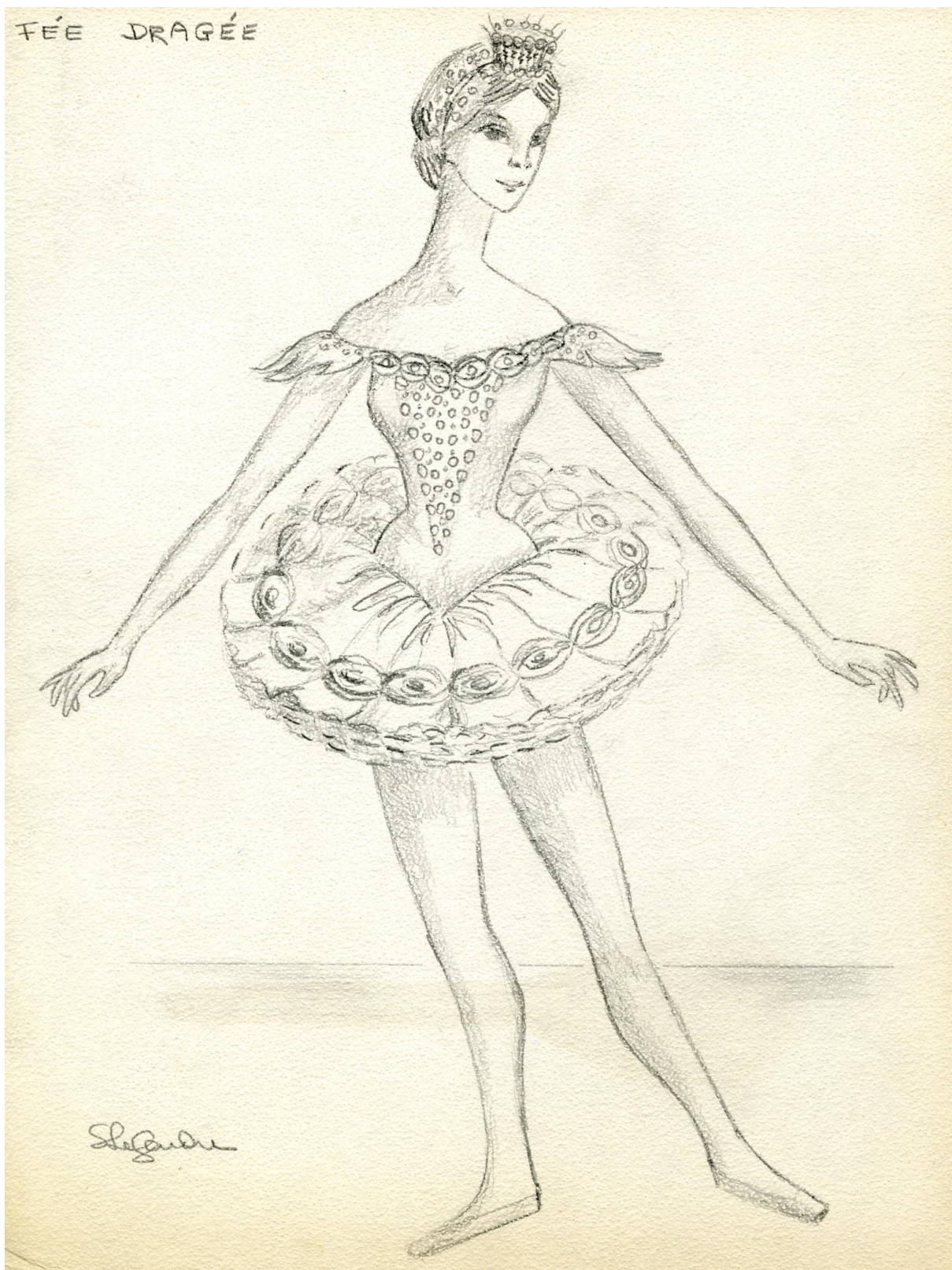
Maquette de la Fée Dragée, 1964.

Collection de BAnQ, Archives nationales à Montréal, fonds Solange Legendre (06M_P846S2SS1D4_6_P3).