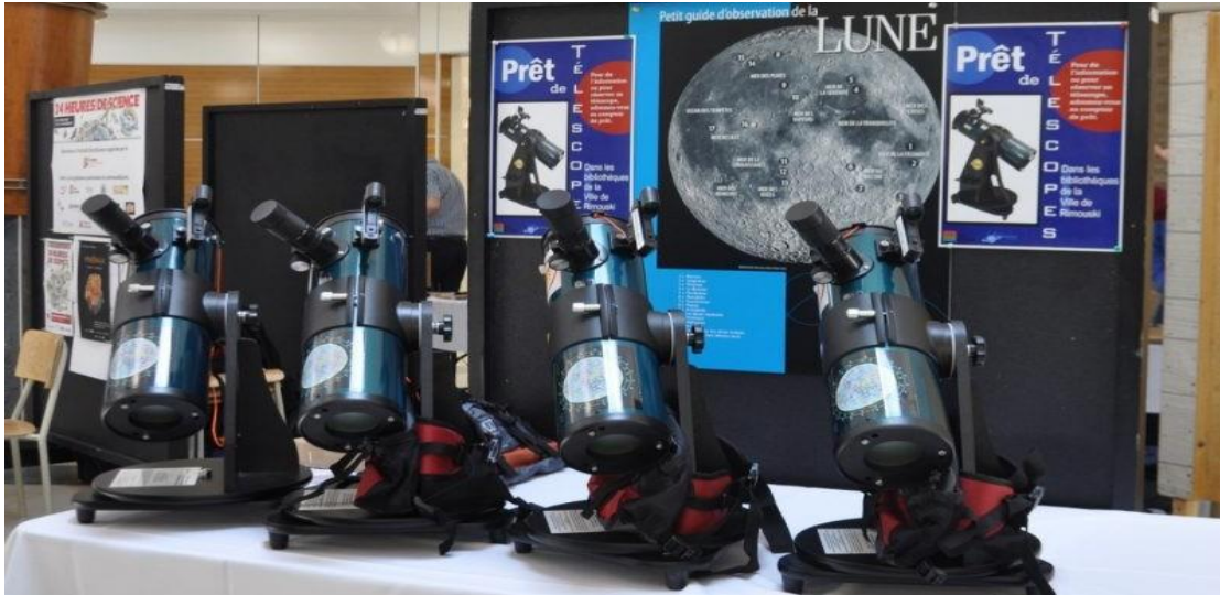
Télescopes du programme Biblioscope pour tous de la bibliothèque Le Bic, Rimouski.

Cette fiche d'information s'adresse à ceux qui aimeraient mettre sur pied un service de prêt d'objets dans leur bibliothèque. Au programme : une mise en contexte pour mieux circonscrire le phénomène ainsi que des conseils pratiques pour vous aider à chaque étape de la mise sur pied du projet .