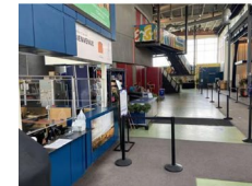
Le hall de la TOHU