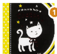
CHATON Meredith Samantha Éditions Gründ