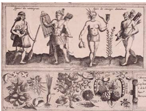
Carte géographique de la Nouvelle France faite par le Sieur de Champlain Saint Tongois capitaine ordinaire pour le Roy en la marine (détail), [18-?]

Pourtant, plusieurs fonds d'archives conservés dans les différents centres de Bibliothèque et Archives nationales du Québec (BAnQ) attestent l'existence de l'esclavage dans la colonie dès le xvii e siècle. D'Olivier Lejeune, premier esclave connu, en passant par Mathieu Da Costa et Marie-Angélique, plus de 2700 esclaves sont enregistrés dans les registres paroissiaux.