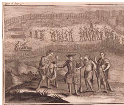
Claude Le Beau, Avantures [sic] du Sr. C. LeBeau : ou Voyage curieux et nouveau parmi les sauvages de l'Amérique septentrionale : dans lequel on trouvera une description du Canada avec une relation très particulière des anciennes coutumes mœurs & façons de vivre des barbares qui l'habitent & de la manière dont ils se comportent aujourd'hui , Amsterdam, Herman Uytwerf, 1738.

Fac-similé d'une carte de 1612 BAnQ Rosemont—La Petite-Patrie