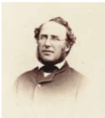
1. Joseph-Charles Taché, vers 1865.