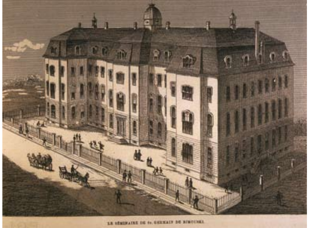
7. Le Séminaire de Rimouski et l'incendie de 1881.

Le Séminaire de St. Germain de Rimouski , tiré de L'Opinion publique , vol. 4, n° 24, 11 juin 1873, p. 281. BAnQ, Collection patrimoniale. Num.