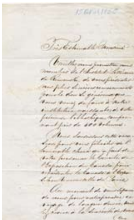
2. Adresse de l'Institut littéraire de Rimouski à Joseph-Charles Taché, 15 avril 1855. BANQ, Centre d'archives de Québec, fonds Famille Taché [P407, S3, G89, feuillets 1 et 2].