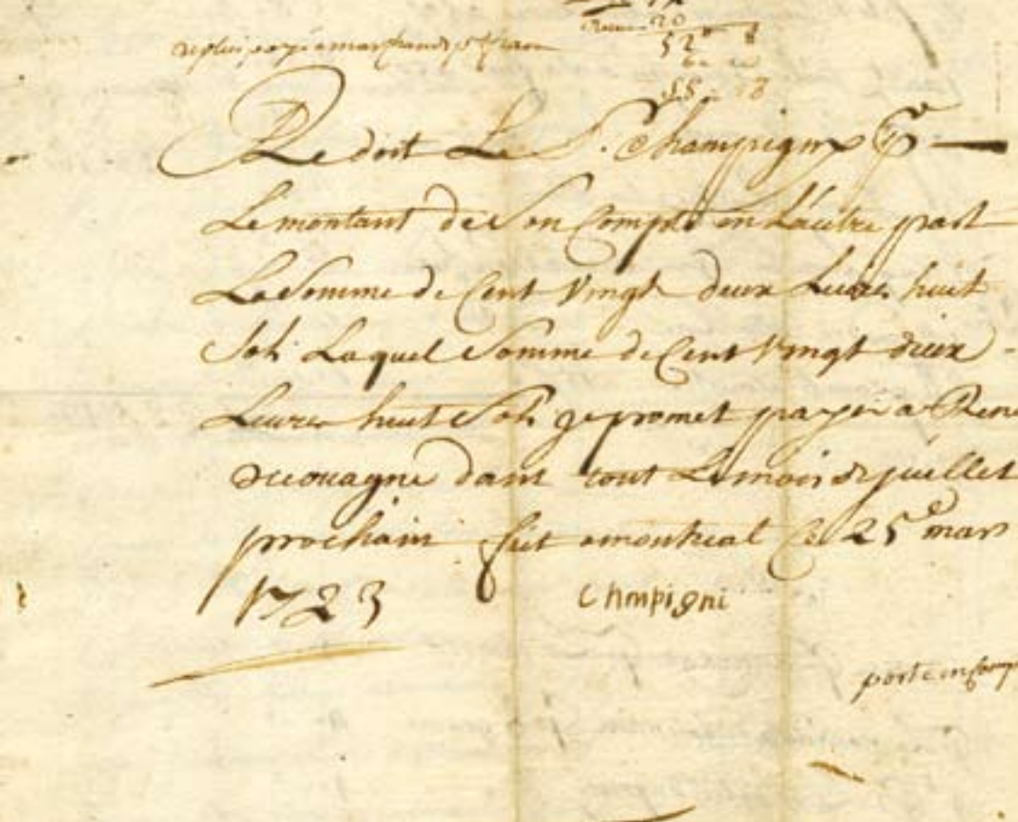
1. Détail de l'état de compte de Jean Deslandes dit Champigny. Procès entre René de Couagne, marchand et bourgeois, demandeur, et Jean Deslandes dit Champigny, maçon, défendeur, pour le paiement d'un compte arrêté, 25 mars 1723 au 16 octobre 1727. BAnQ, Centre d'archives de Montréal, fonds Juridiction royale de Montréal (TL4, S1, D3384). Num.